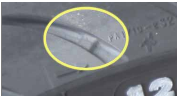
Bild 4: Der Verschleißzustand des Reifens lässt sich an dem sogenannten „Treadwear Indicator“ (TWI) erkennen.

Über den Reifenumfang verteilt sind an sechs Stellen kleine Stege im Profilgrund angebracht. Diese Stege werden auch Verschleißanzeiger oder „Treadwear-Indicator“ genannt und mit TWI angekürzt. Zum leichteren Auffinden dieser relativ unauffälligen TWI werden an der Reifenflanke oder am Rand der Lauffläche kleine Markierungen angebracht. Diese Markierungen können aus den Buchstaben TWI, einem kleinen radial angeordneten Pfeil oder auch Symbolen der Herstellerfirma bestehen. Üblicherweise wird die Restprofiltiefe des Reifens an verschiedenen Stellen der Lauffläche neben diesen kleinen Stegen mit einem Profiltiefenmesser ermittelt. Spätestens wenn das Profil bis auf die Höhe der Stege abgenutzt ist, muss der Reifen ausgetauscht werden, da die gesetzlich vorgeschriebene Mindestprofiltiefe von 1,6 mm erreicht oder sogar bereits unterschritten ist. Die meisten Reifenhersteller empfehlen, einen Reifen bereits bei größeren Restprofiltiefen als 1,6 mm zu ersetzen.