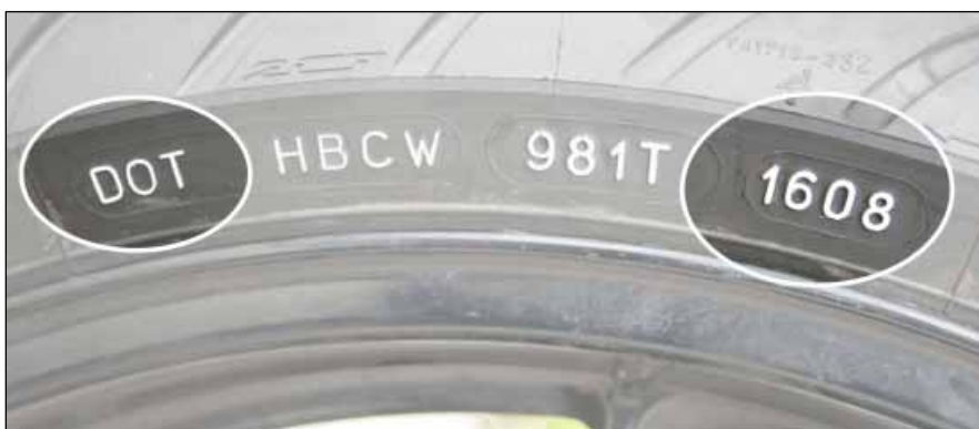
Bild 5: Die DOT-Nummer enthält viele verschlüsselte Daten, das Herstellungsdatum ergibt sich aus den letzten vier Stellen.

Die DOT-Nummer ist eine ursprünglich für den US-amerikanischen Markt vorgesehene, spezifische Kennzeichnung des Reifens, in der die unterschiedlichsten Informationen verschlüsselt sind. Von besonderer Bedeutung sind die letzten vier Stellen, die für das Produktionsdatum des Reifens stehen. Die ersten zwei Stellen – im Beispiel „16“ – stehen für die Produktionswoche, die letzten