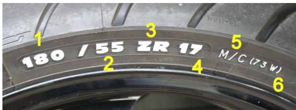
Bild 1: „Neue“ Kennzeichnung von Motorradreifen entsprechend der ECE R 75 (gültig seit 1998)